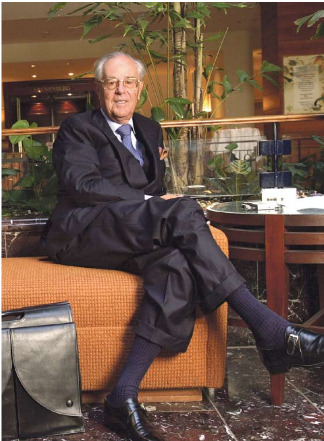
Der 77-jährige Anlageprofi ist für die nahe Zukunft pessimistisch: «2008 wird ein schwieriges Jahr.»